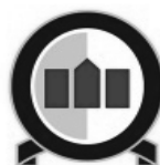
Universidad Andrés Bello